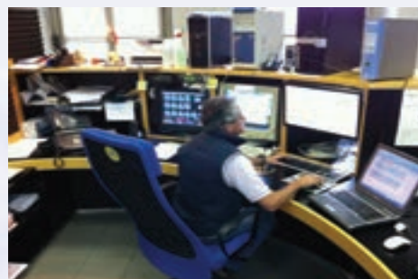
Centrale 118 -CNSAS