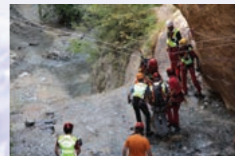
Squadre di terra